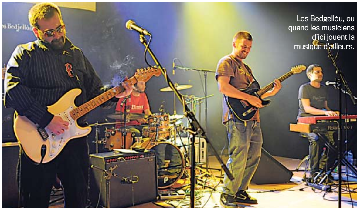
Los Bedjellou, ou quand les musiciens d'ici jouent la musique d'ailleurs.

Deux soirées de mosaïque culturelle les 29 et 30 octobre 2010.