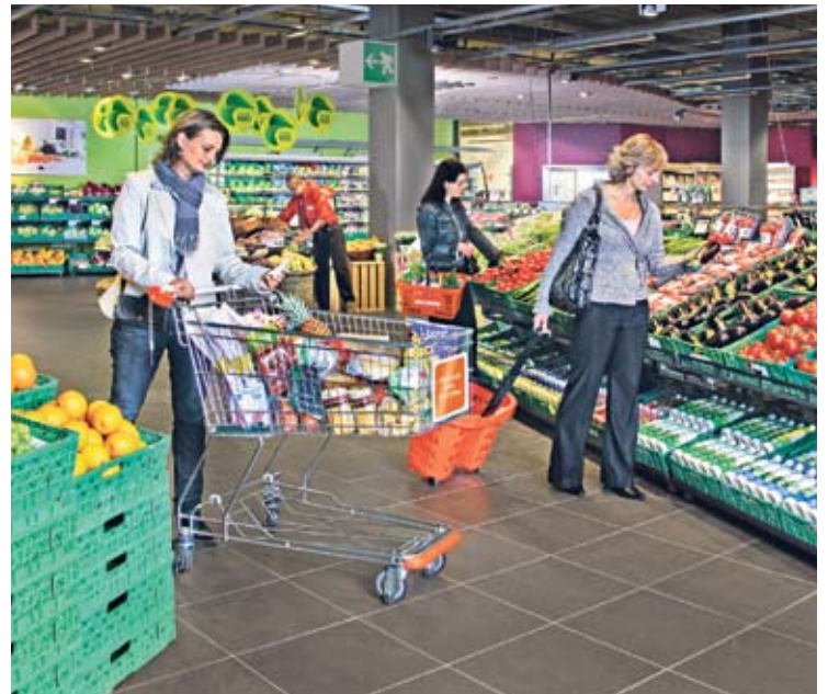
Fruits et légumes frais se présentent dans un espace aménagé comme une place de marché.

Au MParc on trouve tout ce dont une famille a besoin sous le même toit.