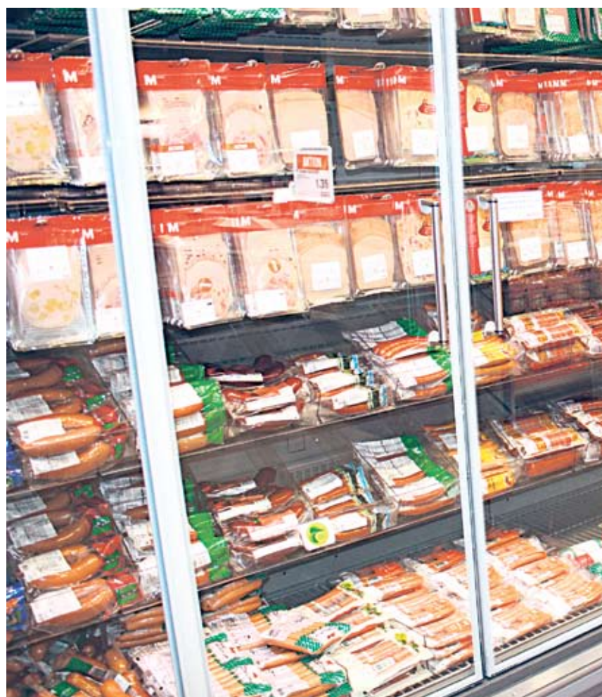
Economiser l'énergie durablement: les nouveaux rayons de produits réfrigérés

L'une d'entre elles a été appliquée dans les nouveaux magasins de Migros Bâle et au MParc rénové.